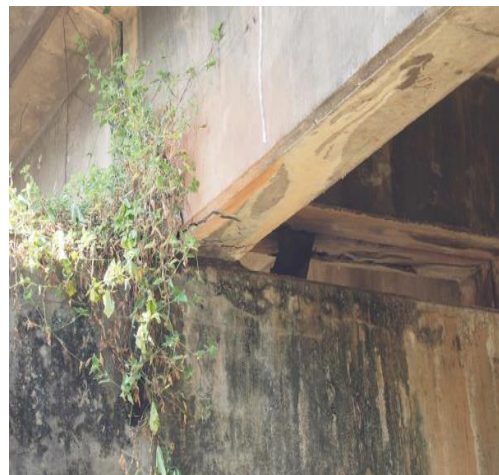
รูปที่ 1 ตัวอย่างความเสียหายของสะพาน

นวัตกรรมประมวลผลด้วยภาพ นั้นถือเป็นวิธีการทดสอบจากภาพด้วยความละเอียดสูง ซึ่งเรียกว่า Image Measurement System โดยวิธีการวัดนี้จะสามารถวัดการเคลื่อนตัวของสะพานทั้งแบบสถิตย์ (Static) และแบบพลวัต (Dynamic) ซึ่งวัดได้ทั้งหมด 3 แกน คือ แกนราบ (Horizontal direction) แกนตั้ง (Vertical direction) และ แกนหมุน (Rotation) นวัตกรรมนี้ยังสามารถช่วยเร่งระยะเวลาในการตรวจสอบ และสามารถตรวจสอบสะพานในพื้นที่ห่างไกลได้อีกด้วย โดยนวัตกรรมนี้ได้นำมาใช้ในการตรวจสอบสะพานหลายแห่งในประเทศ ญี่ปุ่น และยังใช้วัดการเคลื่อนตัวของหมอนรองรถไฟความเร็วสูง หรือชินกันเซ็น (Shinkansen) ซึ่งความถูกต้อง