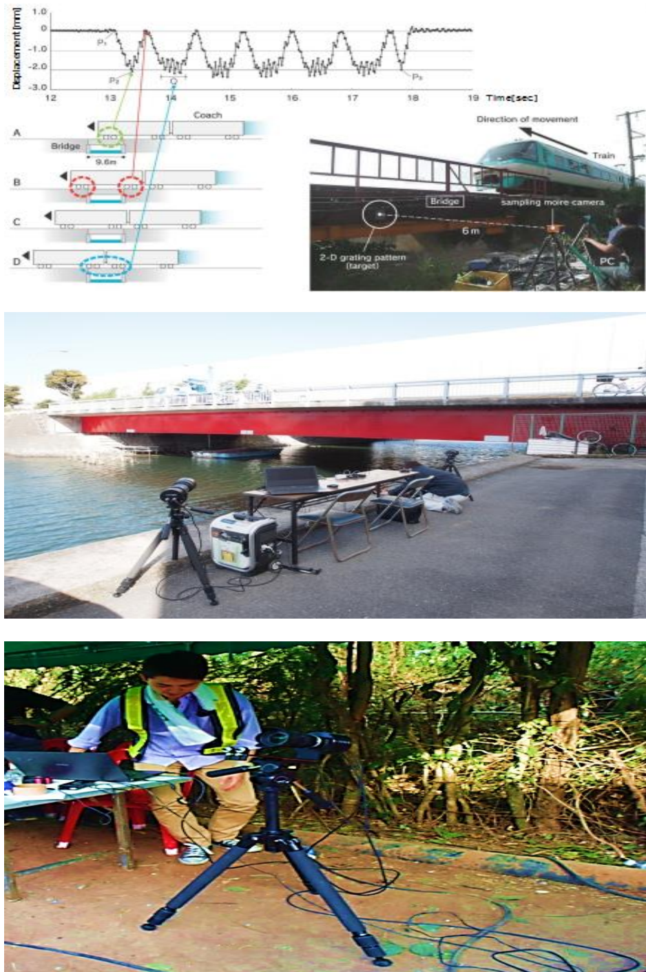
รูปที่ 2 การตรวจวัดโครงสร้างด้วยนวัตกรรมประมวลผลด้วยภาพ หรือ Image Measurement System

แม่นยำมีความสำคัญอย่างยิ่ง เพื่อป้องกันการทรุดตัวของรถไฟ (รูปที่ 2) ในประเทศไทยนั้น นวัตกรรมนี้ได้นำมาใช้ ในการตรวจสอบสภาพของสะพานหลายแห่งแล้ว อาทิเช่น สะพานน้ำพองเก่า และสะพานเดชาติวงศ์ 2 เป็นต้น