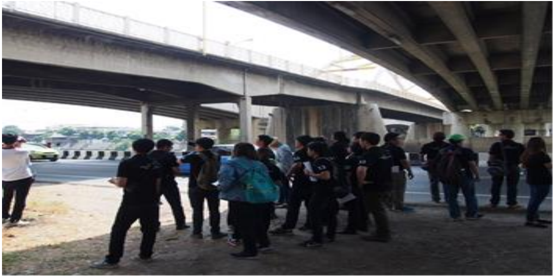
การสำรวจสะพานปรีดี-อึ้ง จังหวัดพระนครศรีอยุธยา