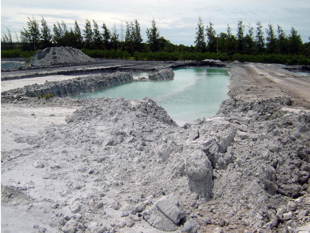
รูปที่ 1 กากแคลเซียมคาร์ไบด์ที่นำมาทิ้ง

ในประเทศไทยพบวัสดุปอซโซลานได้หลายชนิดเช่น เถ้าถ่านหิน เถ้าแกลบ-เปลือกไม้ และเถ้าปล้มน้ำมัน ซึ่งเป็นเถ้าที่ได้จากโรงงานอุตสาหกรรมที่ใช้วัตถุดิบตามภูมิภาคต่างๆ ไปเผาเพื่อผลิตพลังงานไฟฟ้า เป็นต้น สำหรับวัสดุปอซโซลาน (Pozzolan) ตามคำจำกัดความของมาตรฐาน ASTM C618[5] หมายถึง วัสดุที่ประกอบด้วยออกไซด์ของซิลิกา (Siliceous) หรือ ซิลิกาและอลูมินา (Siliceous and Aluminous) เป็นองค์ประกอบหลัก วัสดุปอซโซลานโดยทั่วไปมีคุณสมบัติของวัสดุประสานน้อยมากหรือไม่มีเลย แต่เมื่อวัสดุปอซโซลานมีความละเอียดสูงและมีความชื้นที่เพียงพอสามารถทำปฏิกิริยากับด่างหรือแคลเซียมไฮดรอกไซด์ ( \text{Ca(OH)}_2 ) ทำให้ได้สารประกอบที่มีคุณสมบัติในการยึดประสานได้ดีคล้ายกับปูนซีเมนต์ หรือเรียกปฏิกิริยาที่เกิดขึ้นนี้ว่าปฏิกิริยาปอซโซลาน (Pozzolanic reaction)